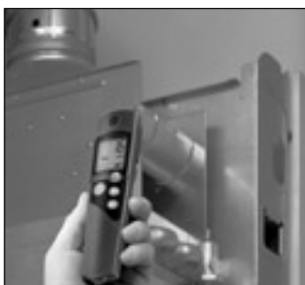
暖房器具の設置、メンテナンス時に現場のCO濃度をチェック

testo 317-3 は、ガスヒーター等周辺のCO濃度を計測し、アラーム表示、およびアラーム音で知らせます。