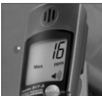
アラーム表示 & アラーム音でお知らせ