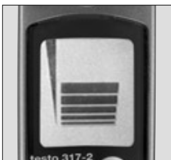
ガス濃度を見やすい棒グラフでディスプレイに表示