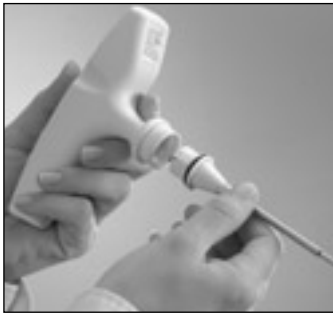
プローブの交換は簡単に行えます