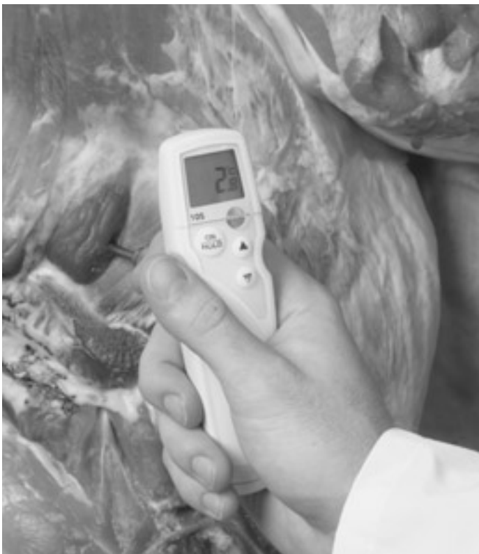
握りやすいグリップハンドル&計測中でも数値を確認できるディスプレイ