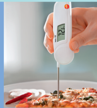
食品加工から調理まで徹底した温度管理でHACCP対策