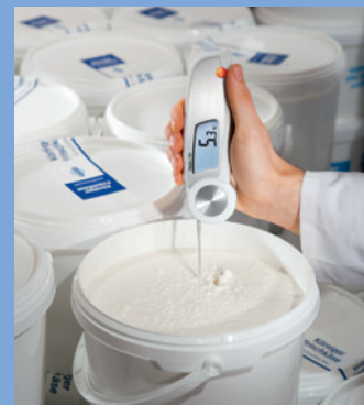
冷蔵食品の受け入れ検査やぬきとり検査に