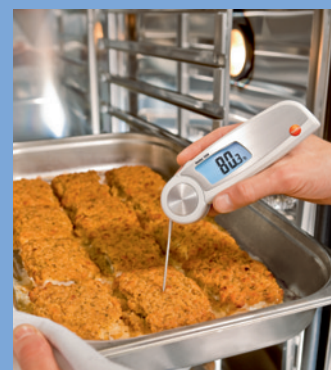
加熱調理ではオートホールド機能が便利 プローブ角度が変えられるのもメリット